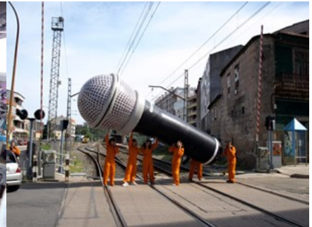
Festival Coiro de Pita (Porriño)