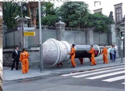
Escoitar no Mediafest (Canarias)