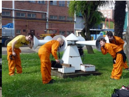
Escoitar no Ateneo Obrero de Xixón