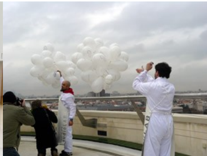
Escoitar no CBA (Madrid)