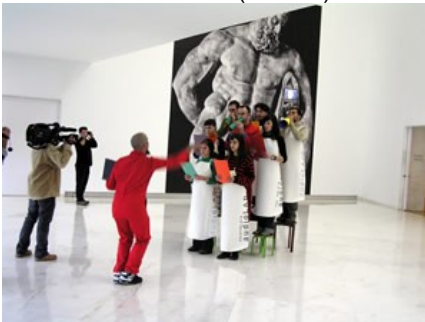
Escoitar no CGAC (Santiago)