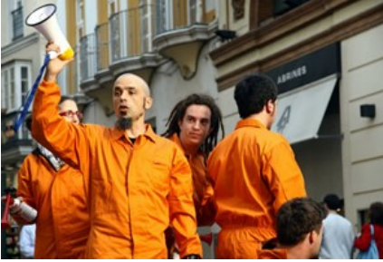
Escoitar no ZEMOS98 (Sevilla)