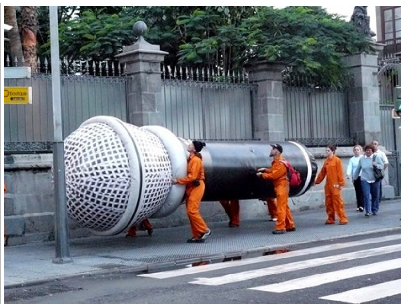
Macrófono no Festival Mediafest (Las Palmas de Gran Canaria)