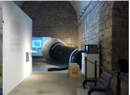
Escoitar no Bòlit (Girona)