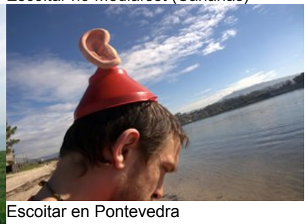
Escoitar en Pontevedra