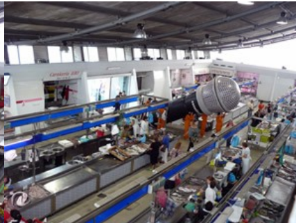
Festival Coiro de Pita (Porriño)