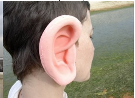
Logo/icono de Escoitar