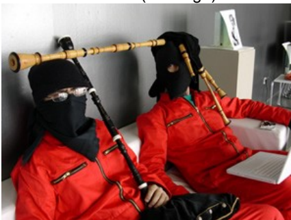
Escoitar no MARCO (Vigo)