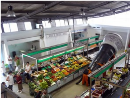
Festival Coiro de Pita (Porriño)