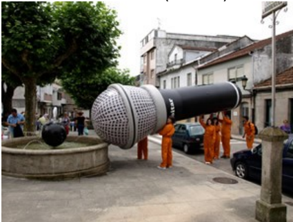
Festival Coiro de Pita (Porriño)